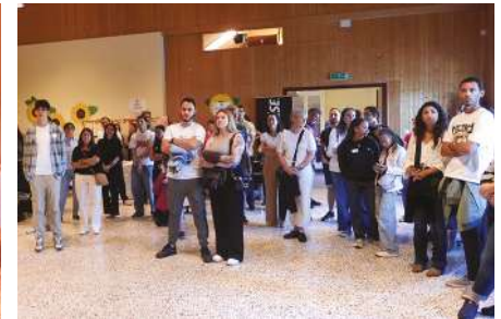
Les nouveaux habitants attentifs à la découverte de Cugy.