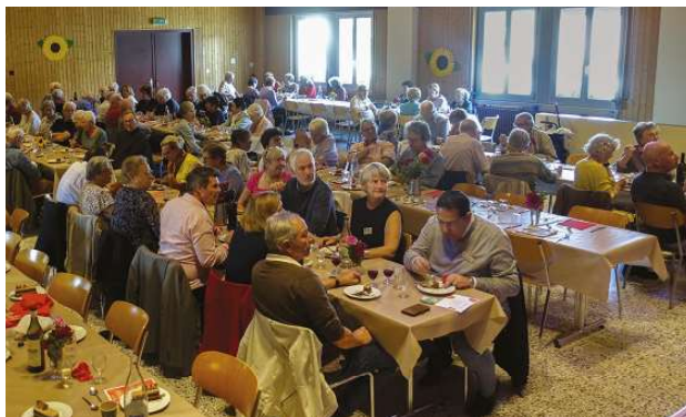
Les Aînés de Cugy, fidèles au rendez-vous.