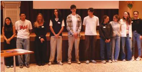
La majorité pour des jeunes cugiéran.