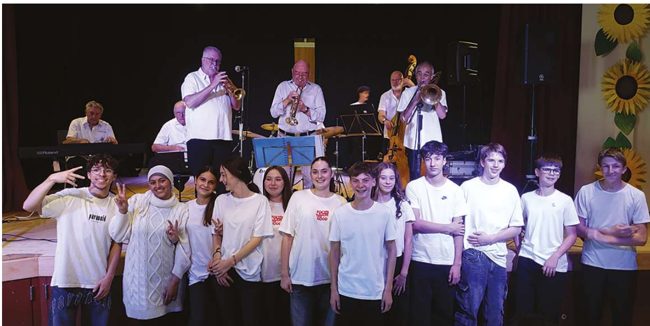
L'orchestre Vufflens Jazz Band et la classe 11VG2.

Alors que l'Union des Sociétés Locales (USL) a mis ses activités en pause momentanément, elle a accepté, à la demande de la Municipalité, d'organiser la traditionnelle Fête des Aînés le 19 septembre dernier.