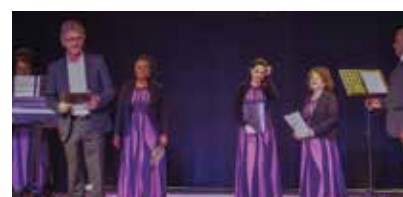
Le groupe Hop Gospel Choir.