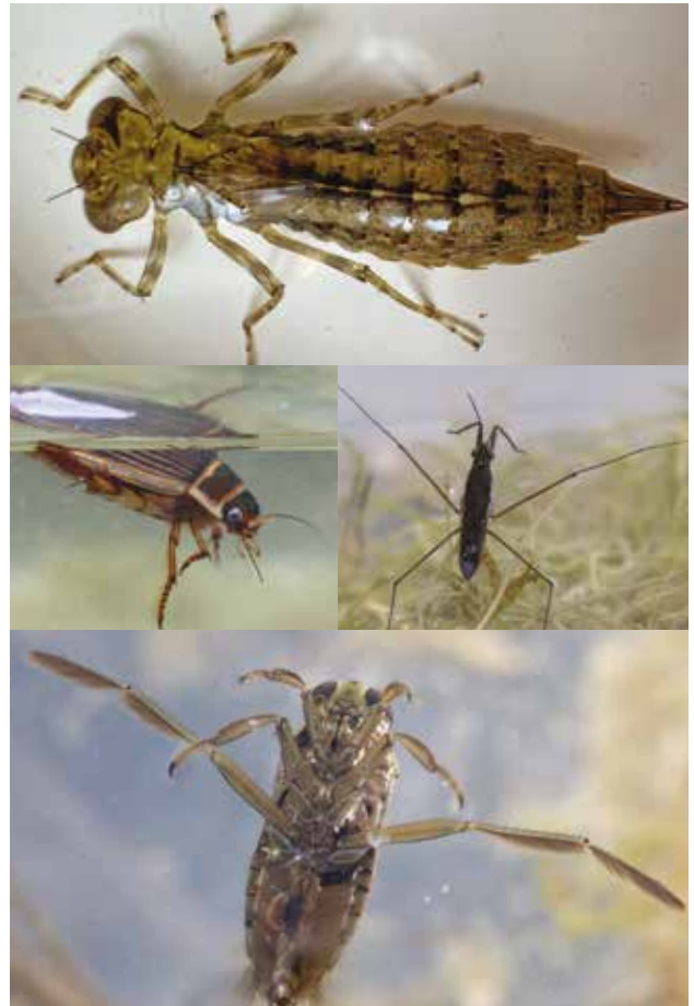
Insectes aquatiques : larve de libellule, dytique, notonecte, gerris (de haut en bas et de gauche à droite)