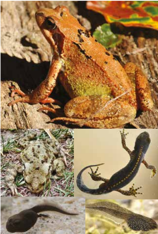
Les batraciens : triton palmé, grenouille rousse, triton alpestre, crapaud commun, têtard de crapaud, têtard de grenouille (de haut en bas et de gauche à droite)