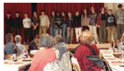
Les élèves de la classe 9VG3.