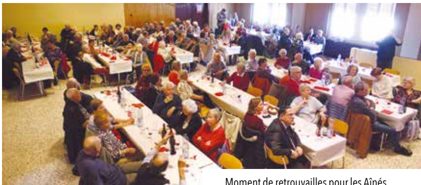
Moment de retrouvailles pour les Aînés.

Texte Simone Riesen